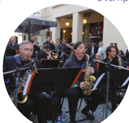
Athens Big Band

*Σε συνεργασία με τον Εξωραϊστικό Σύλλογο Αγίου Παύλου